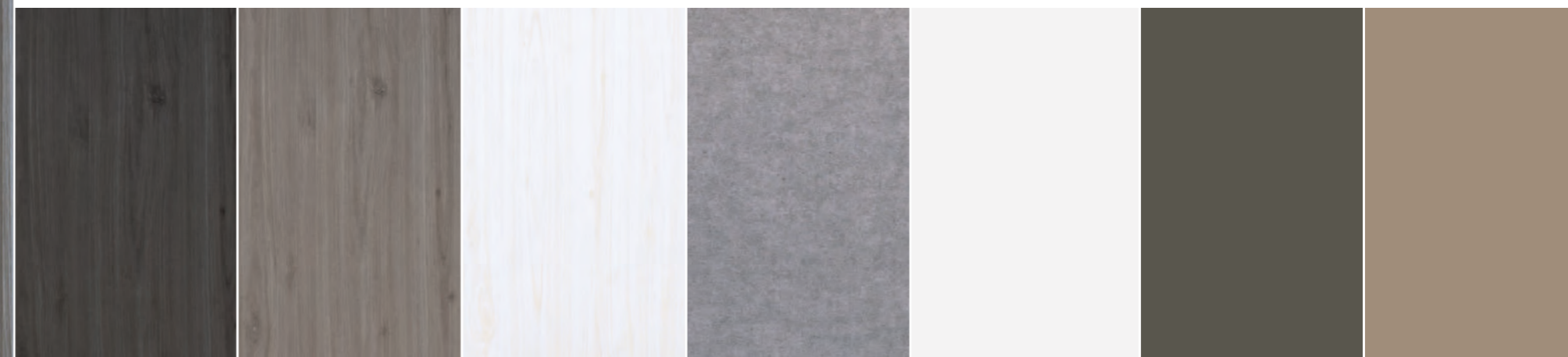
Cappuccino opaco ultramatt